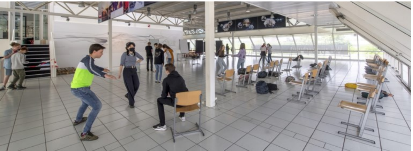
De voormalige showroom van Smeet Mercedes is nu leslokaal.